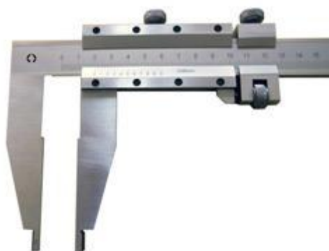
Рисунок 4 – Общий вид штангенциркулей типа ШЦЦ-III Diarazon.