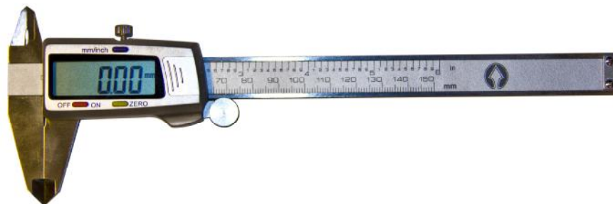
Рисунок 2 – Общий вид штангенциркулей типа ШЦЦ-I Diarazon.